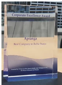
Abbildung 1: Corporate Excellence Award für das litauische Modeunternehmen Apranga, das 2018 als bestes baltisches Unternehmen ausgezeichnet wurde

Bisher haben wir kaum über ihre Börsenrendite gesprochen, obwohl sie Aufmerksamkeit verdient. Jetzt ist es Zeit für eine Veränderung.